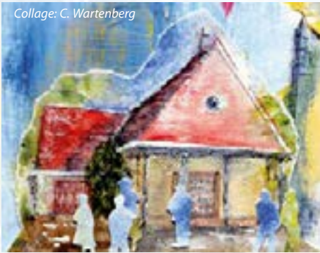
Collage: C. Wartenberg